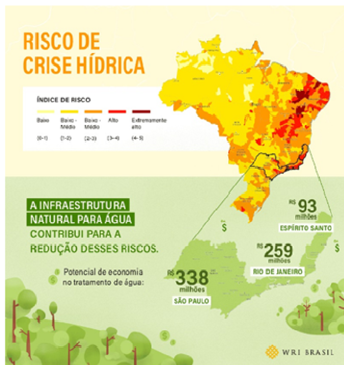
Figura 1. Mapa de risco hídrico no Brasil